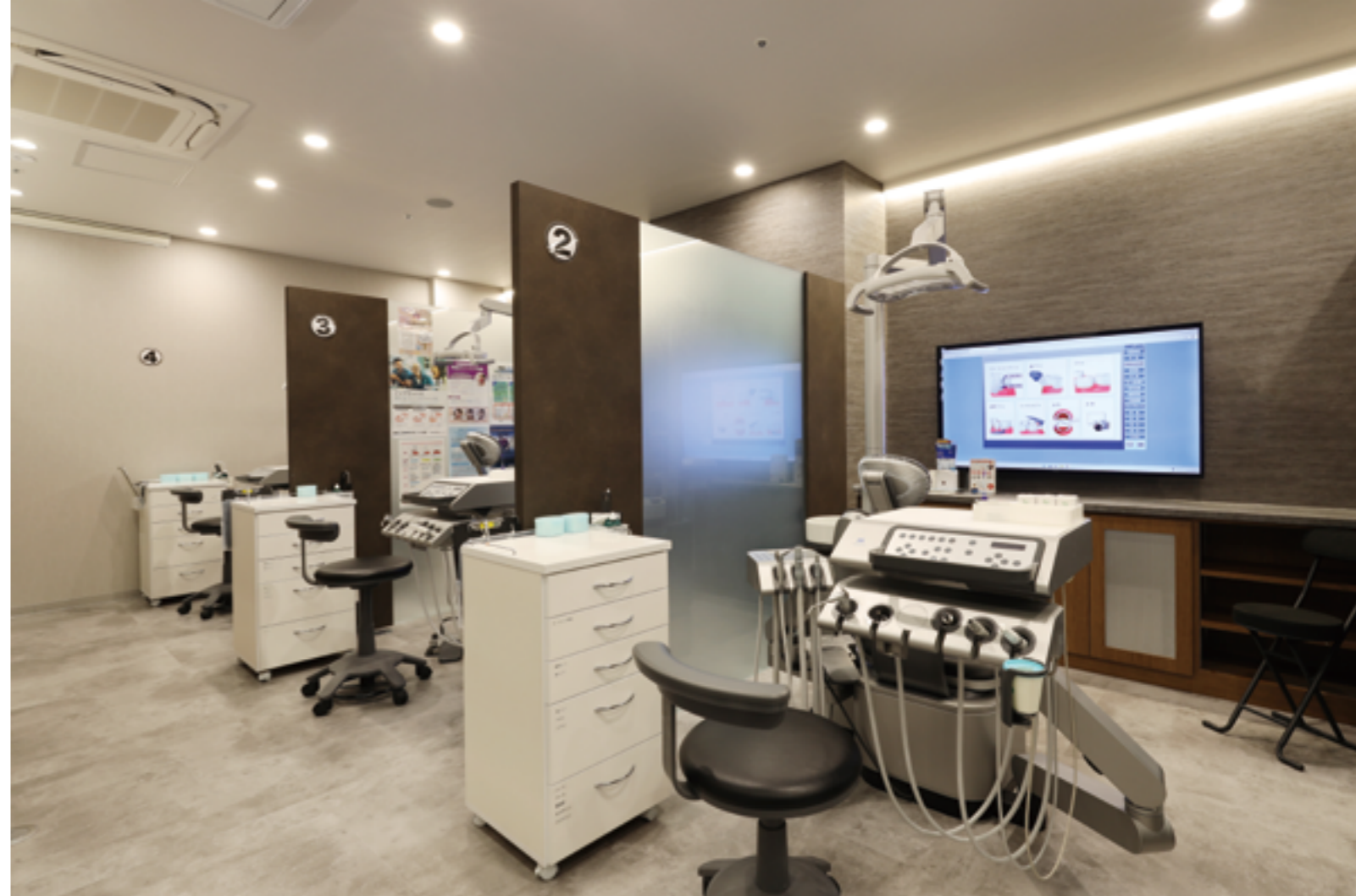
ご紹介の写真は全て 2024年に開院の「大宮いしはた歯科」。大宮駅から車で3分、徒歩でも5分少々アクセスしやすいロケーション。シティホテルが上層階に入る瀟洒なビルの3階にあり、内装も心地良く診療を受けられる様に上品なトーンでまとめられている。上の写真はパーテーションで仕切られた診療ユニット