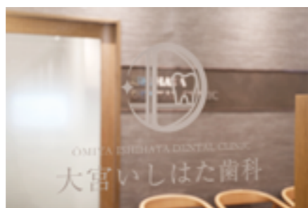
ドクターおすすめのデンタル用品のご購入も可能。パウダールームも完備されているので術後のメイク直しなどもゆっくりと行える