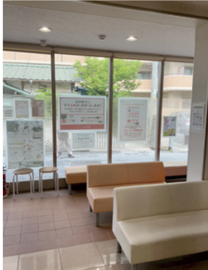
埼玉県久喜市・久喜駅西口から徒歩約2分の「いしはた歯科クリニック」。虫歯や歯周病など一般歯科から小児歯科、矯正歯科、インプラント、入れ歯治療まで幅広く対応している。予防を重視した診療方針のもと、患者様の不安や負担に配慮した診療を心掛け、地域のホームドクターとして親しまれている